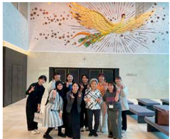
国際平和ミュージアムでのイベント終了後、被爆者の方を囲んで。

被爆地の外で核兵器の話をするための切り口を見つけることは容易なことではないかもしれませんが。それでも多くの人が希求する「平和」のために何ができるのかという課題を共有しながら、「平和」のために核兵器は必要なのだろうか、どうして核兵器は無くならないのだろうかなどの問いを立て、目の前の一人ひとりとの丁寧な対話が、核兵器をなくすための鍵になってくると思います。考え方が違うように思える相手とでも、相手と自分との共通項を見出し、その共通項を軸に対話することを諦めず続けていきたいと考えています。