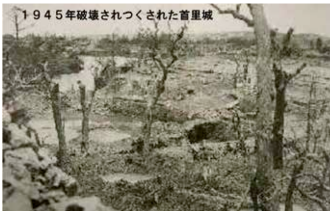
1945年破壊されつくされた首里城

何日目かのある日、祖父と兄がひとつの壕を見つけました。その壕はコの字形の丘に内側から地下壕が掘ってあるものでした。その小さな壕に入ることを許し