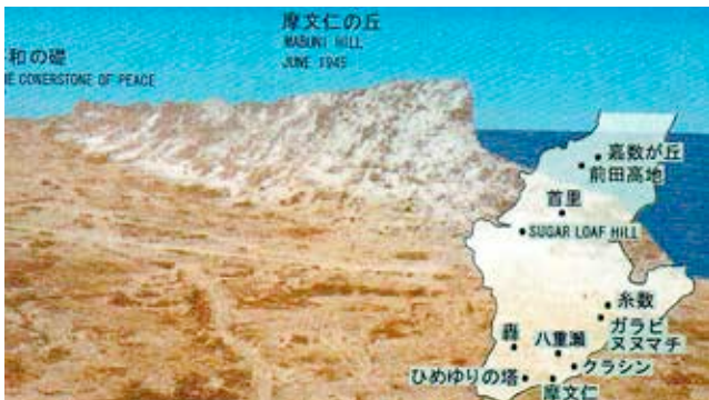
1945年当時の摩文仁が丘

頂上へ着いてまず驚きました。丘の峰々からザッザッと一点に人びとの流れが向かっていました。その先は、