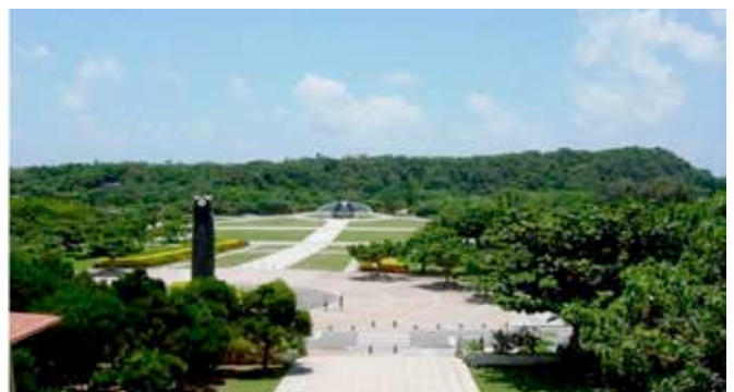
2018年の摩文仁が丘 (平和祈念公園)

戦争を起こさない為にどうすればいいか。世界の人々は思っているのです。まずは、過去の愚かさを知る事、知らなければ何も始まらない、そして目覚める事。ある人が書いていた「敵を作らない事、優れた外交努力こそ最大の抑止である」と。その通りです。文化交流、経済協力、道はあるはずで。