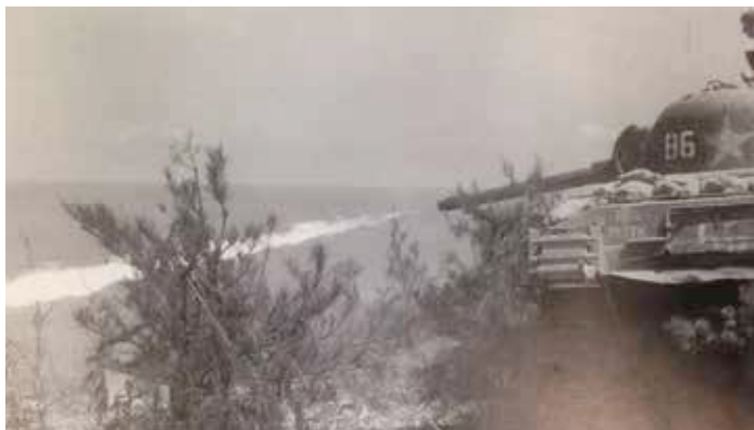
米軍の火炎放射器

戻った翌日だったと思います。野戦病院から連絡が来ました。その丘の近くのたくさんの防空壕が敵の火炎放射でやられた、もうここにはおれないので、野戦病院は移動します、皆さんもどこかへ逃げてください、という連絡なのです。やっと入れてもらえた防空壕があるのだからここにいる、とは言えません。火炎放射というのは艦砲射撃のように軍艦から打ち込んでくるわけでもなく、グラマンのように機銃掃射で打ち込む銃弾のようでもなく、上空から落とす爆弾でもありません。戦車に砲筒を取り付けて放射する。砲弾が打ち込まれるのではなくて火を噴く兵器なのです。燃えるものは何でも焼きつくすという恐ろしいものです。程なく焼かれることを承知でそこに残ることはできません。けれどもこれから先、防空壕があるかどうか分からない。それでもとにかくそこからは出なければいけませんでした。