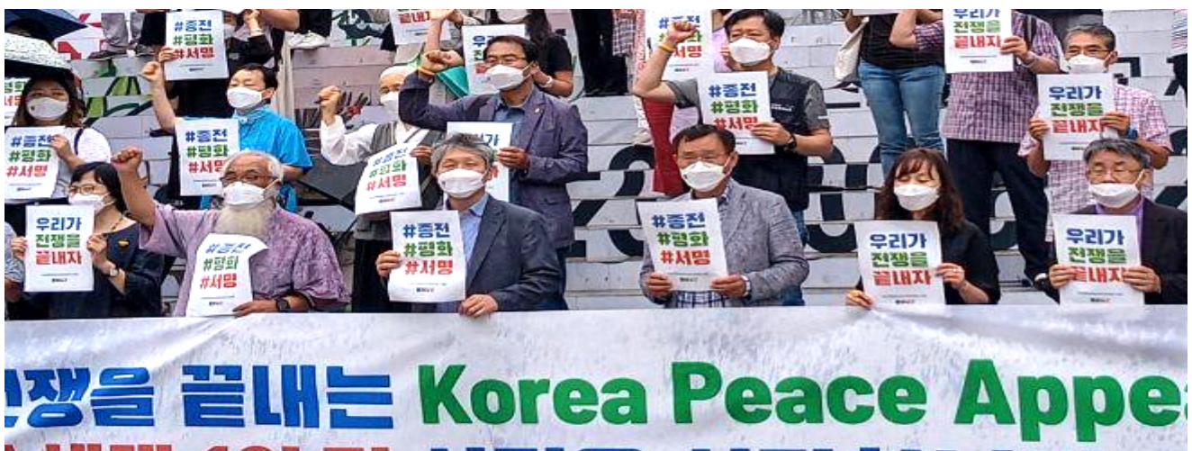
朝鮮半島問題を自分たちで解決しようと立ち上がった市民が「朝鮮半島終戦平和キャンペーン」を始めた。

返してきました。その中で市民はいくども挫折や無力感をおぼえてきました。でも、もうそれではダメです。70年、戦争が終わらないという時間は長すぎます。もはや市民が直接立ち上がって朝鮮戦争の終息を宣言し、世界中の市民に私たちの宣言を支持してくれるよう訴えようと思います。キャンペーンは昨年の「朝鮮戦争」停戦協定締結の日である7月27日にスタートしました。停戦協定締結70年になる2023年までに、終戦の平和メッセージを込めた朝鮮半島平和宣言 (Korea Peace