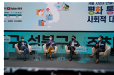
2018年8月に行われた「平和と統一のための社会的対話」の様子。